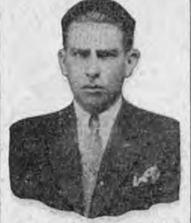
Lic. don TEODORO PICADO, Secretario de educación pública