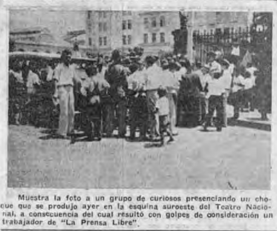
Muestra la foto a un grupo de curiosos presenciando un cheque que se produjo ayer en la esquina suroeste del Teatro Nacional, a consecuencia del cual resultó con golpes de consideración un trabajador de "La Prensa Libre".