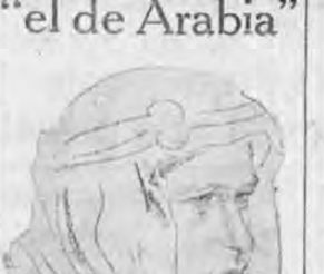
Lawrence "el de Arabia"

En nuestro servicio cablegráfico de ayer aparece un despacho dando cuenta del grave accidente ocurrido al coronel Lawrence, llamado "el rey sin corona" de Arabia, quien se encuentra a las puertas de la muerte a causa de las terribles lesiones que sufrió. Es la de Lawrence una de las figuras más interesantes de la guerra mundial. Su vida novelesca es digna del medio misterioso en que desarrolló sus principales actividades, las que le hicieron famoso en el mundo entero. Fue él el organizador, o más prolijo dicho, el inspirador de la revuelta árabe contra los turcos y a favor de los Aliados. Estudiante de arqueología de Oxford, la guerra le sorprendió cuando realizaba excavaciones en Carthelms, junto al Eufrates. Su novena decena de años de edad, se consagró al estudio de la historia y de la arqueología. Fue él el organizador, o más prolijo dicho, el inspirador de la revuelta árabe contra los turcos y a favor de los Aliados. Estudiante de arqueología de Oxford, la guerra le sorprendió cuando realizaba excavaciones en Carthelms, junto al Eufrates. Su novena decena de años de edad, se consagró al estudio de la historia y de la arqueología.