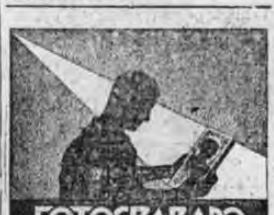
FOTOGRAFADO DE LA TRIBUNA EL MEJOR DE CENTRO AMERICA