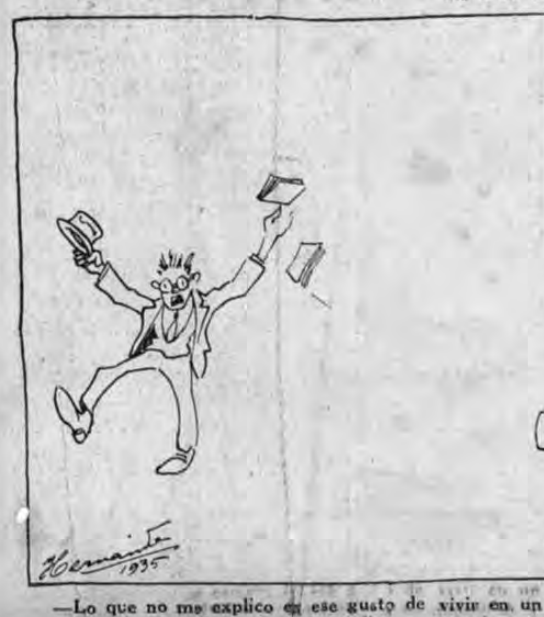
—Lo que no me explico es ese gusto de vivir en un perpetuo pleito! —Están en su elemento. Así estudian y practican a la vez!